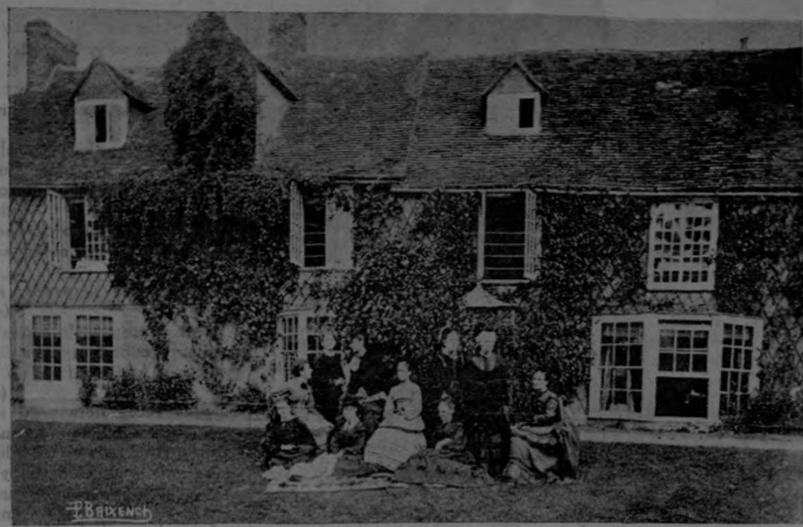
LAS CINCO FUNDADORAS DE NEWHAM Y GIRTON

A unas cincuenta milas de Londres hacia el Norte, está situada la histórica ciudad de Cambridge, originalmente la plaza fuerte de Cambroritum establecida por los romanos, fortificada luego por los sajones, y más tarde por los normandos.